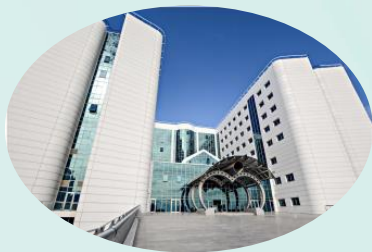
Near East University