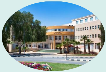
Cyprus International University