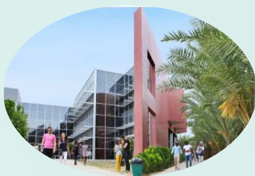
Eastern Mediterranean University (EMU)

Средняя стоимость обучения в университетах Северного Кипра – от 4000 £ в год.